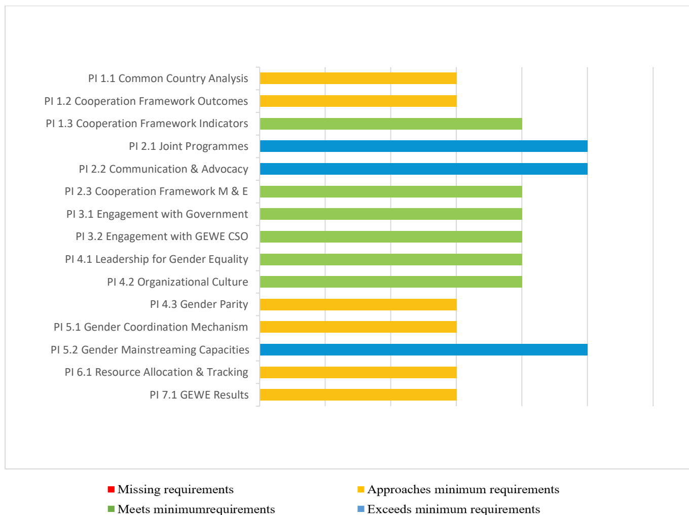
Cuadro 2: Panorama general de los resultados acumulados del UNCT-SWAP en 2023

Los hallazgos presentados en la siguiente tabla indican las calificaciones obtenidas por el UNCT en Venezuela para cada indicador de desempeño en las siete dimensiones de análisis tal como están en 2023. Incluye las calificaciones reevaluadas en 2023 y las calificaciones obtenidas de años de informes anteriores.